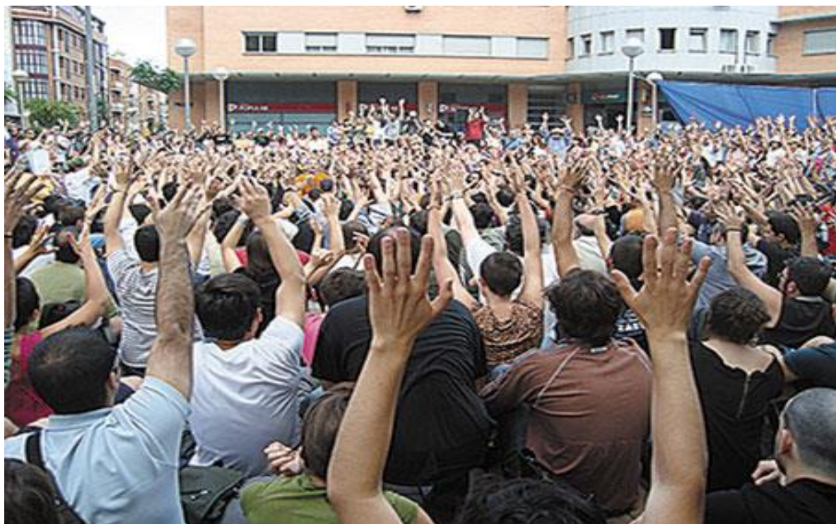
Asamblea del 15M en la Plaza de las Palomas (mayo de 2011)